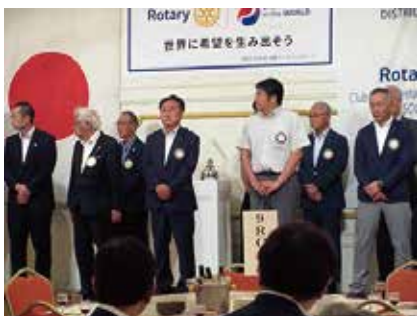
9 R C 新会長・幹事の皆さん