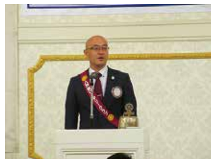
出席報告 南 R C 西尾親睦委員長