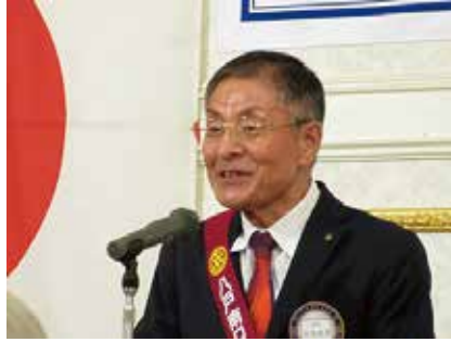
乾 杯 長嶺パストガバナー