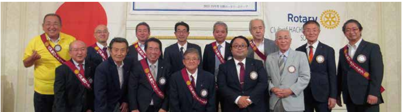
皆さんお疲れ様でした