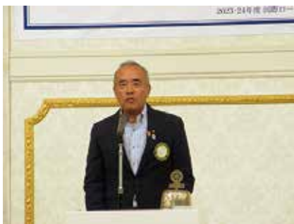
来賓挨拶 築館ガバナー