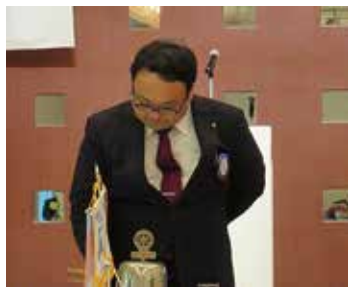
大橋会長初めての点鐘

この数年間体調の悪い会長が続いておりますが、先ずは体に気を付けて、今日から1年間皆様と一緒に学んで行こうと思います。1年間よろしくお願いいたします。