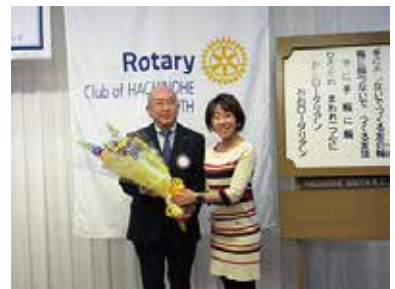
会長・幹事一年間お疲れ様でした。