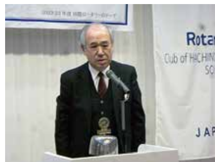
小原相談員 (大澤相談員分も 合わせて報告)