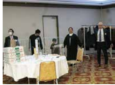
手をつながない手に手つないででお開きとなりました。