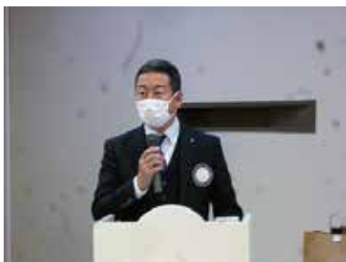
司 会 出員委員長