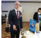
西尾会長初めての点鐘