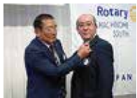
松田会長から 慶徳副幹事