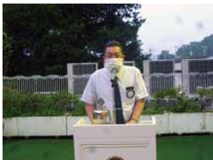
松橋出席・親睦活動委員長