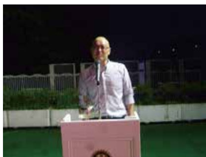
中締め 西尾会長エレクト