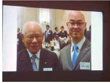
田中作治 元R I会長と