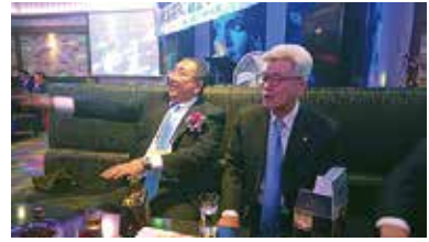
東均さんあれなあに？