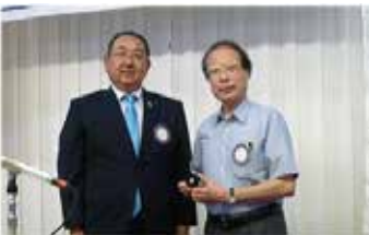
MP F 1 回目 西村会員