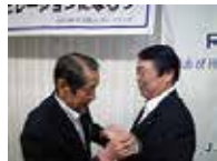
三川副会長から 榎次年度副会長