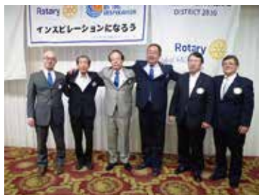
一年間お疲れ様 次年度よろしく