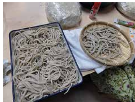
うまく出来たかな？ 左はお手伝いの方が作りました（笑）