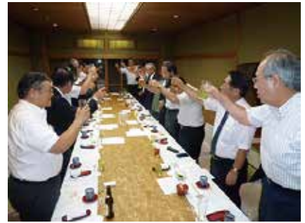
中締め 三川副会長