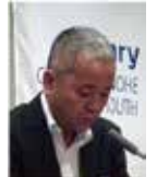
桜田職業奉仕委員長