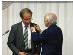
米内会長から 西村会長エレクトへ