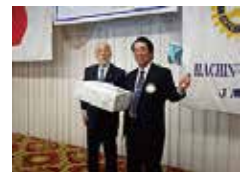
第 13 位 熊谷会員