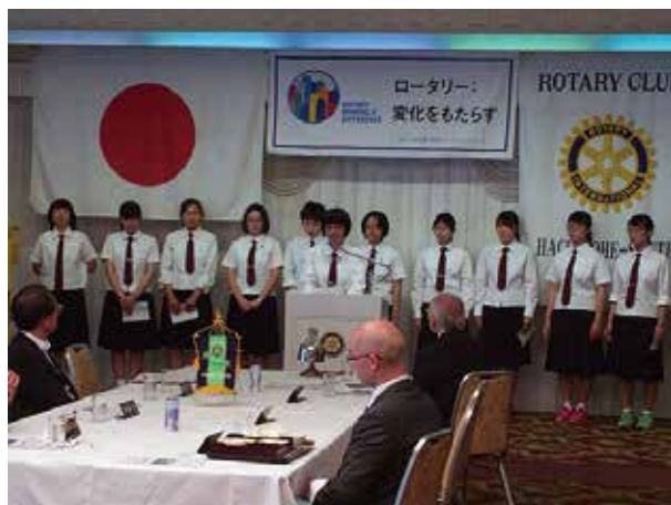
八戸高校 J R C インターアクト愛好会の皆さん

インターアクトの皆さん、アクトの翼を始めさまざまな蕪島、児童科学館の祭典でのボランティア、成人式等、そして最後はクリスマス家族会での踊り等、小さな子との交わりというのを大事にしてくれて本当にうれしく思います。今発表された事、そしてそれを今後また実行に移しながら皆さんのこれからの活躍する場に生かしていただければ大変嬉しく思います。12月にはクリスマス会がございしますのでその時には楽しい踊りを期待しています。それと同時に7月21日、22日とインターアクトの年次大会が八戸のシーガルビューホテルで行われます。皆さんの中から何名かでも参加していただいで他の学校の生徒との交流を深めていただければ大変うれしく思います。本日はどうもありがとうございました。