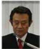
久保田職業奉仕委員長