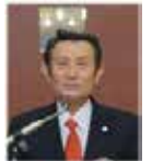
久保田職業奉仕委員長