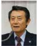
久保田職業奉仕委員長