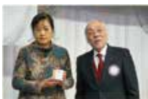
小笠原会員 (地区大会表彰伝達)