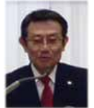
久保田職業奉仕委員長