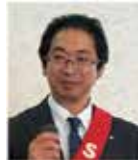
清川 S A A