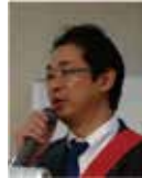
清川 S A A

クラブ協議会 2017 年 8 月 17 日 (木) 点鐘 12：30 レポート No. 1464