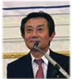
久保田職業奉仕委員長