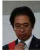
清川 S A A