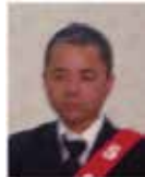
桜田 S A A