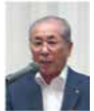
石橋職業奉仕委員長