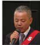
桜田 S A A