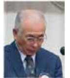
石橋職業奉仕委員長