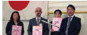
原会員、西尾会員、平光会員