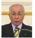
石橋職業奉仕委員長