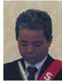
桜田 S A A