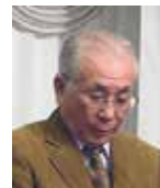
石橋職業奉仕委員長