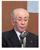
石橋職業奉仕委員長