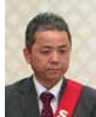
桜田 S A A