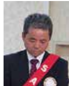
桜田 S A A