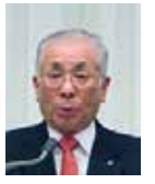
石橋職業奉仕委員長