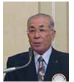
石橋職業奉仕委員長