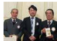
橋本会員 熊谷会員