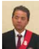
桜田 S A A