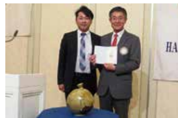
米山功勞者 2 回目