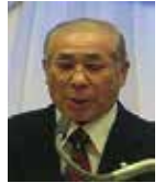
石橋職業奉仕委員長