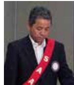
桜田 S A A