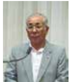
石橋職業奉仕委員長