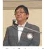
伊藤職業奉仕委員