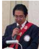
清川副 S A A