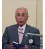
石橋職業奉仕委員長