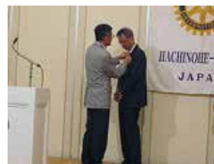
長嶺ガバナーより バッジ伝達