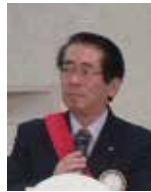
熊谷 S A A