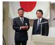
長嶺会員 (7 回目)