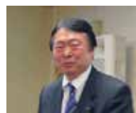
榎会長 (1 回目)