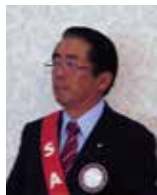
熊谷 S A A