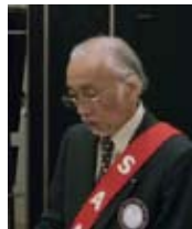
米内 S A A