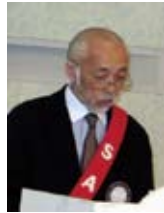
米内 S A A