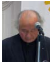
四つのテスト 原田職業奉仕委員長