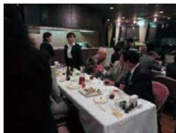
中締め 山子副会長